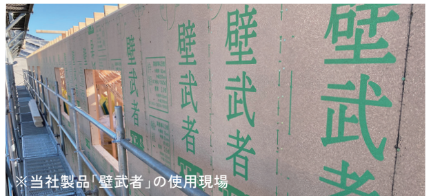
※当社製品「壁武者」の使用現場

当社は、建物の解体時や、ビルやマンションの建設時等に発生する「廃木材」に着目し、1991年(平成3年)より「廃木材」を原材料としたパーティクルボードの生産を開始しました。当社のサービスは、廃棄物処理業(木くず)とパーティクルボードの製造及び販売を両軸とし、廃棄物として収集した廃木材が燃やされることなく資源として有効利用され、パーティクルボードに生まれ変わり建物等に使用されています。この「リサイクリング」は、当社の取引先である木質資源循環推進パートナーの協力により実現しています。